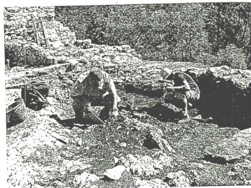
Studenti al lavoro.

Raggiunta la testata settentrionale del Monte Casale, superati i resti di tre imponenti livelli di mura, in parte ancora visibili, si svela quella che doveva essere "un'opera estesa ed intenzionale – come spiega l'archeologo Enrico Cavada – non un centro abitato, ma una fortezza, forse un castello, notevole per dimensioni e complessità delle strutture murarie, progettato su iniziativa pubblica, probabilmente per controllare una strategica via di collegamento che, salendo dal Lago di Garda e attraverso le valli del Trentino occidentale, manteneva in comunicazione la Pianura Padana con le Alpi fino al cuore del centro Europa". "Il quadro che si sta lentamente componendo – aggiunge Cavada – è quindi un panorama di strutture, di manufatti, di reperti mobili, di indicazioni culturali differenti per età e destinazione, in grado di delineare prime traiettorie cronologiche. I reperti più antichi appaiono verosimilmente legati all'orizzonte culturale dell'alto medioevo, tra il V e il VII secolo, quindi all'età carolingia tra l'VIII e il IX secolo e infine al medioevo quando, all'arco temporale tra il X e l'XI secolo sembrano riconducibili i ruderi murari della chiesa visibile". Particolarmente suggestivo il riferimento all'età carolingia, fase storica durante la quale potrebbe essere stato innalzato l'oratorio dedicato a San Martino, la figura di santo alla quale erano legati i re Franchi e Carlo Magno in particolare.