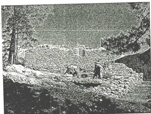
Studenti al lavoro.

Raggiunta la testata settentrionale del Monte Casale, superati i resti di tre imponenti livelli di mura, in parte ancora visibili, si svela quella che doveva essere "un'opera estesa ed intenzionale – come spiega l'archeologo Enrico Cavada – non un centro abitato, ma una fortezza, forse un castello, notevole per dimensioni e complessità delle strutture murarie, progettato su iniziativa pubblica, probabilmente per controllare una strategica via di collegamento che, salendo dal Lago di Garda e attraverso le valli del Trentino occidentale, manteneva in comunicazione la Pianura Padana con le Alpi fino al cuore del centro Europa". "Il quadro che si sta lentamente componendo – aggiunge Cavada – è quindi un panorama di strutture, di manufatti, di reperti mobili, di indicazioni culturali differenti per età e destinazione, in grado di delineare prime traiettorie cronologiche. I reperti più antichi appaiono verosimilmente legati all'orizzonte culturale dell'alto medioevo, tra il V e il VII secolo, quindi all'età carolingia tra l'VIII e il IX secolo e infine al medioevo quando, all'arco temporale tra il X e l'XI secolo sembrano riconducibili i ruderi murari della chiesa visibile". Particolarmente suggestivo il riferimento all'età carolingia, fase storica durante la quale potrebbe essere stato innalzato l'oratorio dedicato a San Martino, la figura di santo alla quale erano legati i re Franchi e Carlo Magno in particolare.