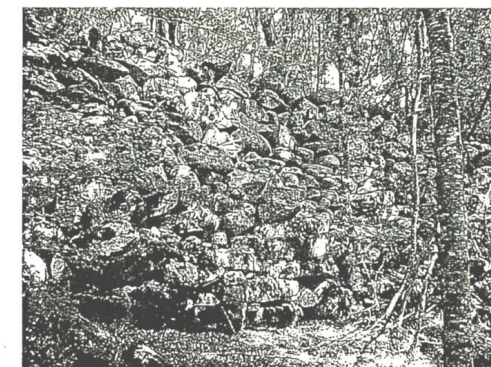
Ciò che resta dell'imponente cinta muraria.