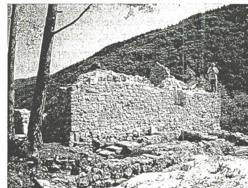
L'area degli scavi.

Paolo Diacono, storico longobardo dell'VIII secolo, nella sua Historia Longobardorum ci tramanda un elenco di castra (castelli) distrutti dai Franchi nel 590 (tra questi troviamo anche un Ennemase sul quale sono state formulate diverse ipotesi di identificazione. La più comune lo vuole associare con Castelfeder presso Montagna, un'altra, invece, con Lomaso. Alla luce dei recenti ritrovamenti Ennemase potrebbe essere proprio il "nostro" San Martino, un santo, quest'ultimo, "particolarmente amato dai Longobardi convertitisi al cattolicesimo che ci introduce nell'era carolingia, dalla quale quella longobarda, e quindi l'anno 590, non erano più così lontani".