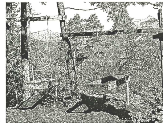
La selezione dei reperti.

Nascosto e quasi protetto dal bosco e da un'intricata vegetazione, lungo la strada bianca che da Lundo porta al Passo di San Giovanni, anticamente importante via per raggiungere il Lago di Garda (nell'arco temporale all'incirca tra il IV e il VI secolo il percorso Garda-Giudicarie-Val di Non costituiva un'importante collegamento tra la pianura e le Alpi, in alternativa alla Val d'Adige, attraverso la quale nel 16 a.C. viene costruita la via Claudia Augusta), il sito archeologico, nella prima fase di scavi conclusasi all'inizio di settembre 2005, ha riportato alla luce, a fianco, dell'oratorio di San Martino, documentato dal XVI secolo tra le cappelle rurali della pieve di Lomaso, i segni di una fortezza molto più antica, mai citata nelle fonti scritte né nei documenti medievali e bassomedievali.