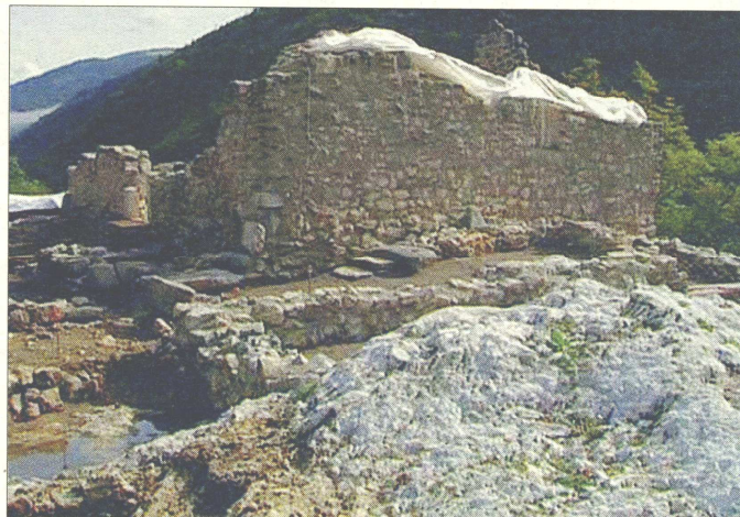
IL CANTIERE. I resti della fortezza del Monte di San Martino, nel Lomaso; a sinistra l'anello trovato grazie agli scavi archeologici

l'area di scavi. Il sito archeologico del Monte San Martino ospita notevoli opere di fortificazione e di frequentazione durante i difficili anni che vedono la presenza e il sovrapporsi di Goti, Bizantini, Longobardi e Franchi nel territorio trentino. Un sito di notevoli potenzialità in relazione alla possibilità di acquisire dati e documenti su un periodo storico che è stato cruciale negli esiti che esso ha avuto per l'intera storia regionale. L'area archeologica misura circa due ettari e fino ad og-